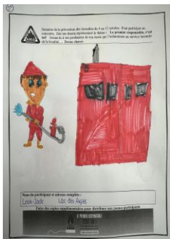
3 e année – Léah-Jade Bérubé-Ouellet