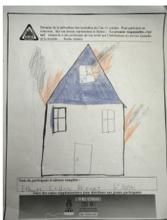
6 e année – Ethan Leblanc Breault

Voici la gagnante du tirage de l'APEQ en 3 me place, d'un montant de 50$.