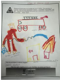
Maternelle – Dahlia Ouellet

Voici donc, les gagnants de ce tirage pour l'année 2025 :